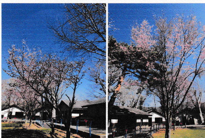
【10周年記念で植樹した桜も、22年経ち見事な花を咲かす並木になりました。今年は満開。】