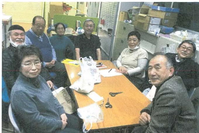
【ホッカホッカの山手センター ハサミを持った、汗と努力のメンバーたち】