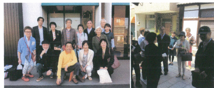
【昼食をとったホテルの前で(何人か足りません)】

三原からは瀬戸内海沿いに走る呉線に乗り換え、竹原までの鉄道旅。お天気も良く、景色も最高でした。去年の朝ドラでブームとなったマッサンの実家を初め、頼山陽の祖父宅、古い街並みをプロのガイドさんの説明付きで楽しみました。