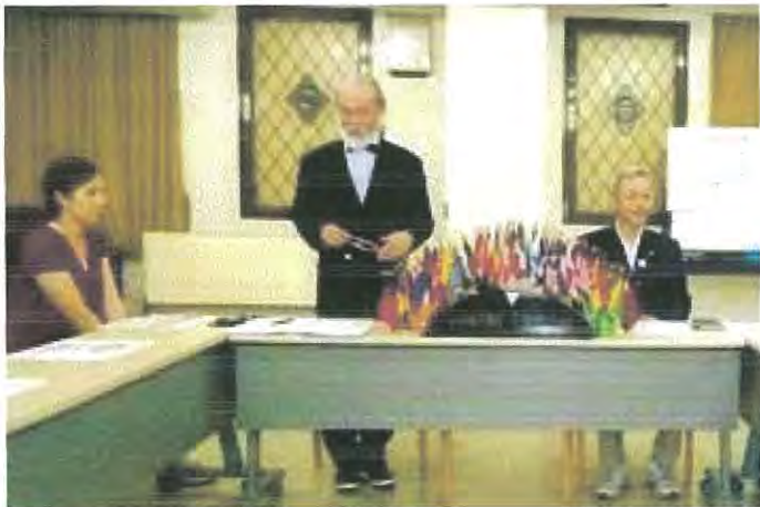
【長津新会長の所信表明】

語ってもらいました。入会式を後回しにしたため、ワインテイ スティングしながらのハッピーバースデー、YMCA報告、ニコ ニコと続きました。