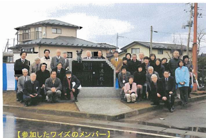
【参加したワイズのメンバー】

世の中の人々には知られなくても、ワイズメンの働きは立派だなど、深く感じ入った一日でした。