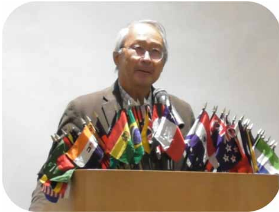
24年3月 次期会長・部役員研修会の際 (YMCA 東山荘にて)