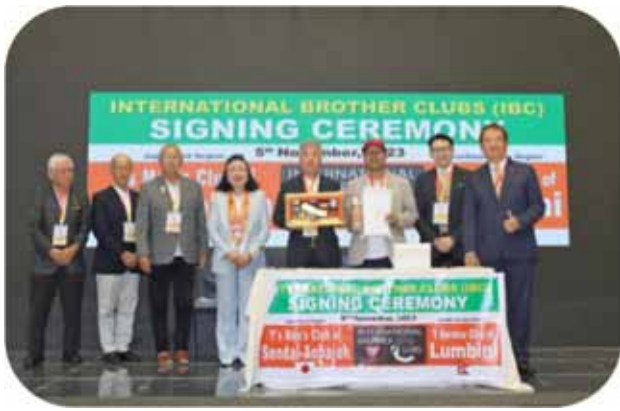
アジア太平洋地域大会の際の IBC 調印式 (仙台青葉城クラブ×ネパールルンビニクラブ)