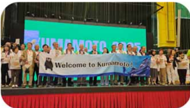
次回のアジア太平洋地域大会は熊本にて開催