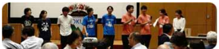
部大会にて活動報告の様子

上のユースアクションとは別に、小さい規模であっても、東日本区では 4-5 か所のユースレッドプロジェクトを行います。例えば北海道には 3 つのクラブがありますが、その中でいくつかのクラブと YMCA でユースアクションに取り組みたいと計画しています。小さい規模の学生 YMCA でもいくつかこのプロジェクトに挑戦してもらいたいと思います。