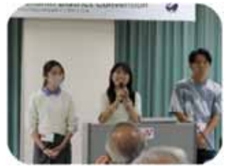
部大会にて AYC 報告の様子

もう一つの大きな事業は Asia Youth Convocation (AYC) です。アジア太平洋地域主催の 4泊5日の国際研修でネパールのカトマンズで行われました。東日本区からは 13名のユースの参加があり、推薦クラブのサポート、部レベルからのサポート、さらには東日本区基金 (JEF) から各参加者への支援金が提供されました。参加したユースは皆、新たな国際体験を通して大きな自信を感じる体験となりました。