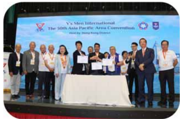
アジア太平洋地域大会の際の IBC 調印式 (川越クラブ×所沢クラブ×フィリピンパンガシナンクラブ)