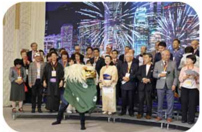
東日本区の出し物（獅子舞い、歌）